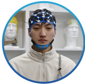
一体帽无需安装电极