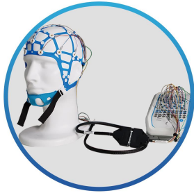
搭配转接线缆使用